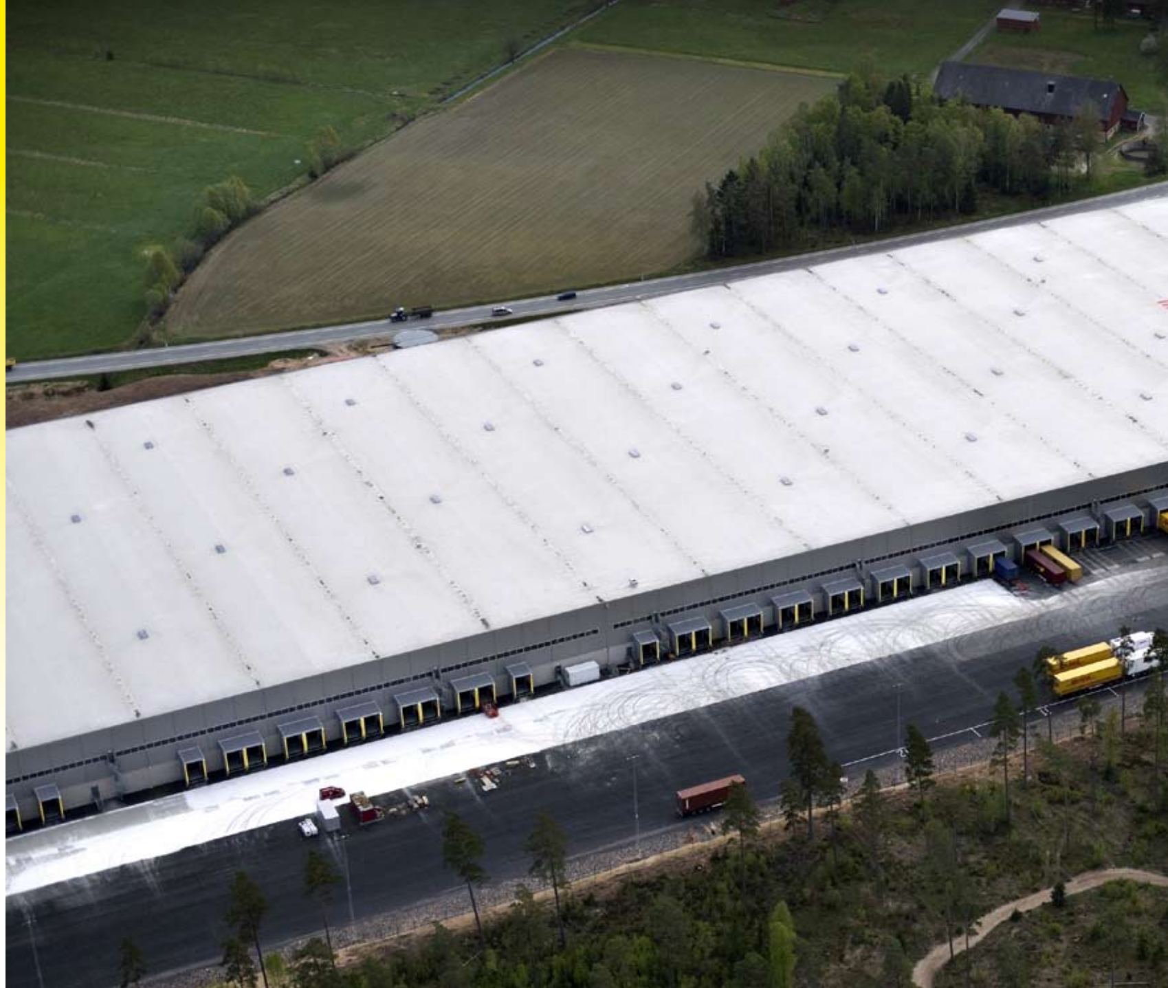
ProLogis Park DC1 och DC2 i Jönköping Beställare: ProLogis, total byggyta: 85 000 kvm färdigställt: april 2009.

Vi har sedan starten byggt anläggningar med en sammanlagd yta på mer än 400 000 kvm.