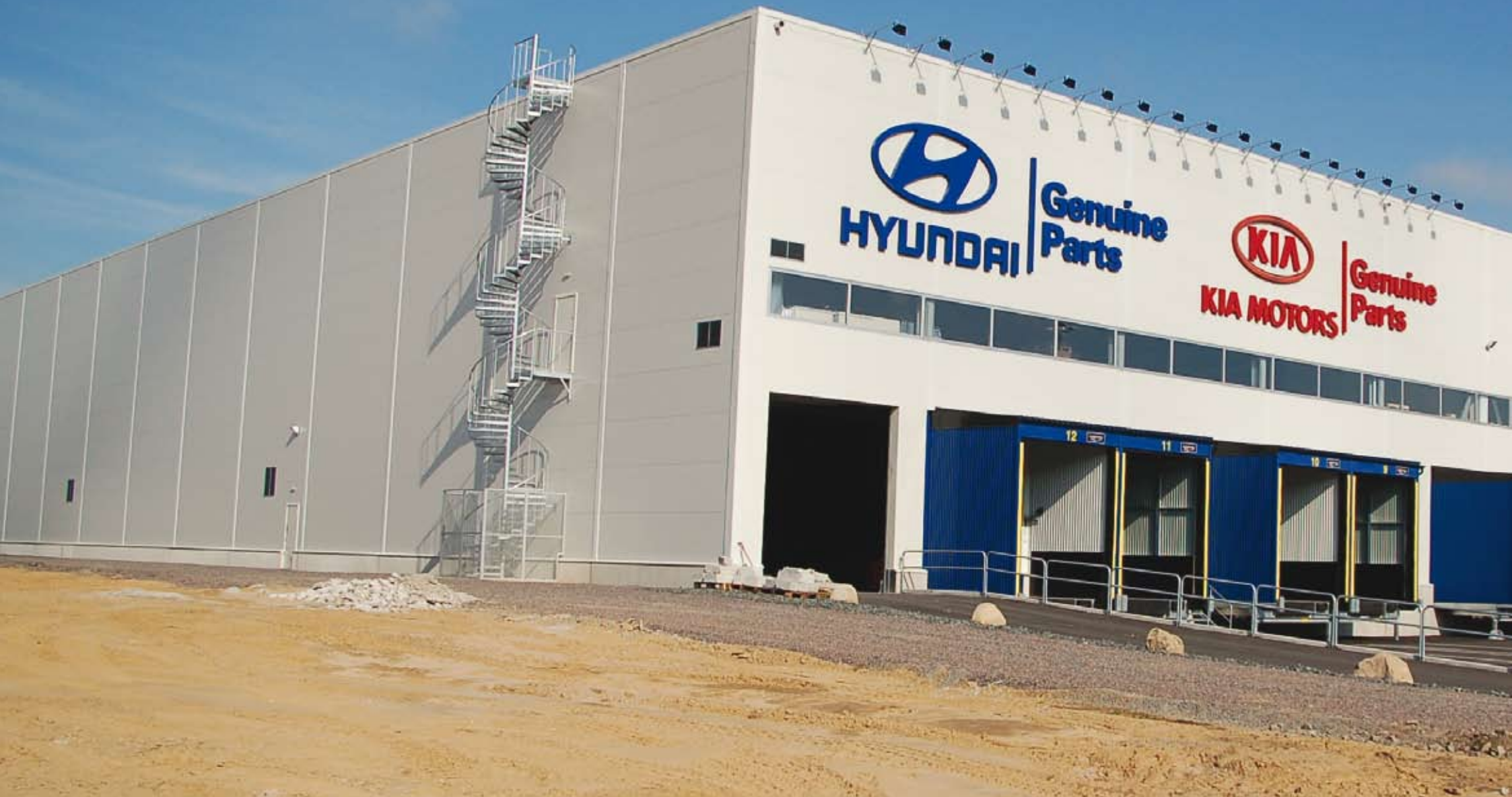
En avancerad logistikbyggnad i Torsvik, strax söder om Jönköping för Mobis Parts Europe, som distribuerar reservdelar och tillbehör till Hyundai och Kia. Den nya anläggningen på ca 15 000 kvm är ett logistiknav för distribution av delar och tillbehör till cirka 500 återförsäljare av Kia och Hyundai i Norden och Baltikum. Färdigställt december 2008.