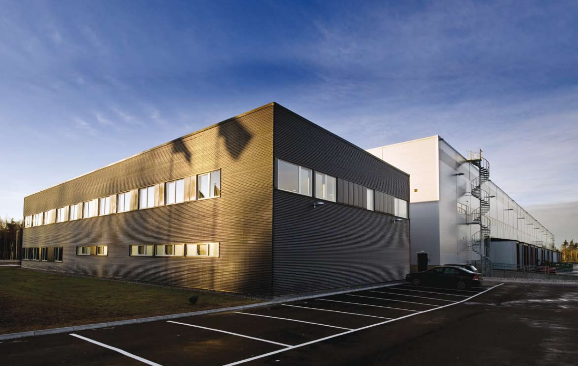
ProLogis Park, Arlanda, DC1. Ny logistikbyggnad för ProLogis i Västra Arlandastad. Total byggyta: 25 000 kvm Hyresgäst: Schenker Logistics AB. Färdigställt December 2008.